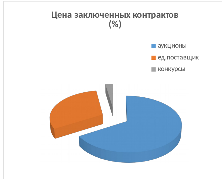
Цена заключенных контрактов (%)