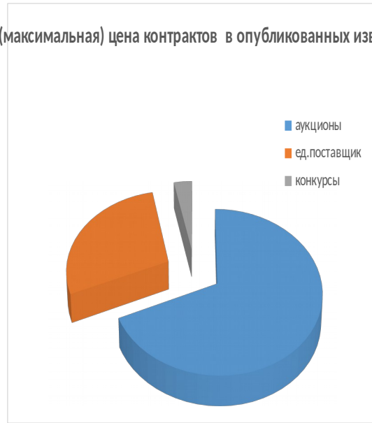
Начальная (максимальная) цена контрактов в опубликованных извещениях (%)