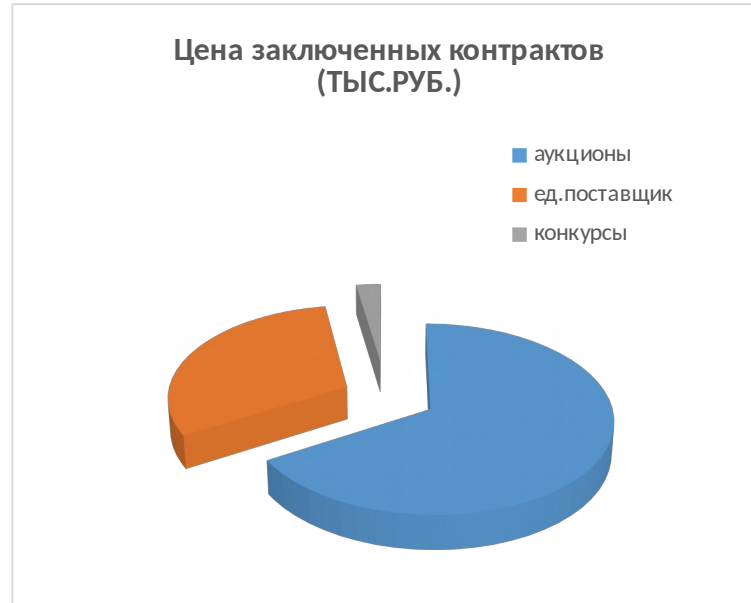
Цена заключенных контрактов (Тыс.Руб.)