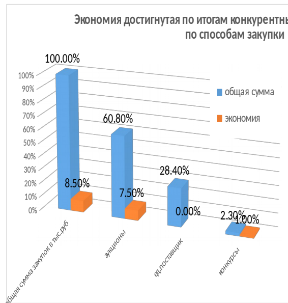
Экономия достигнута по итогам конкурентных процедур в разрезе по способам закупки (тыс.руб)